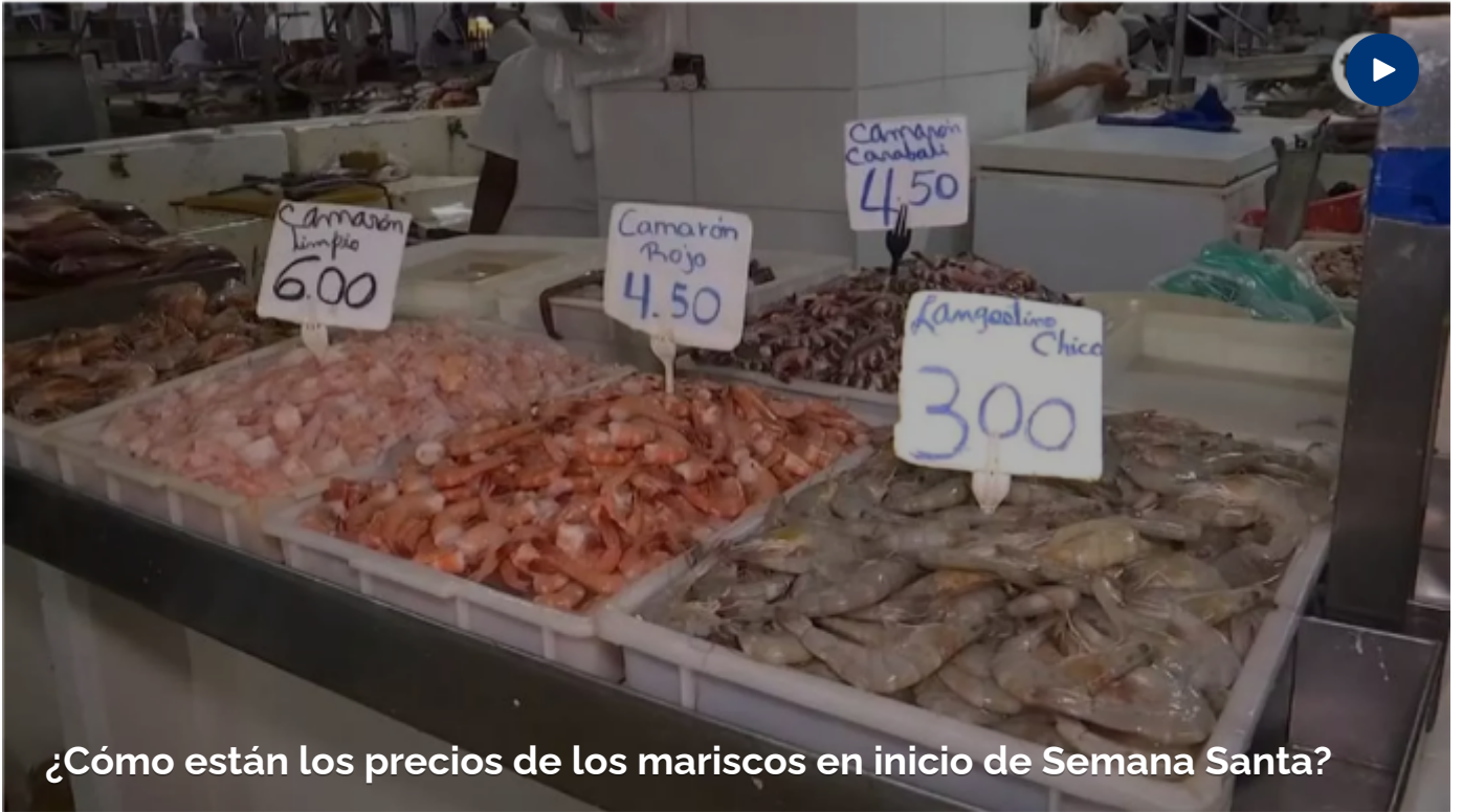
¿Cómo están los precios de los mariscos en inicio de Semana Santa?