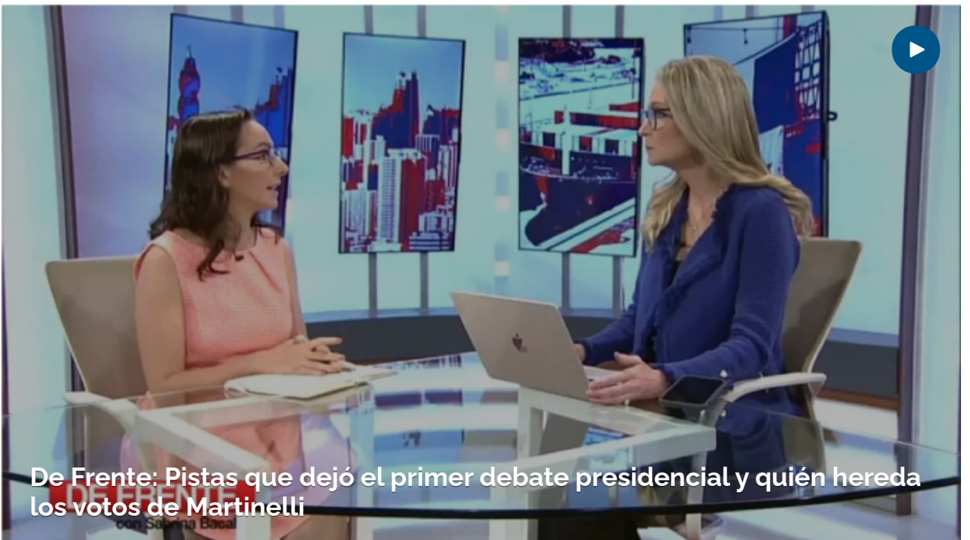
De Frente: Pistas que dejó el primer debate presidencial y quién hereda los votos de Martinelli