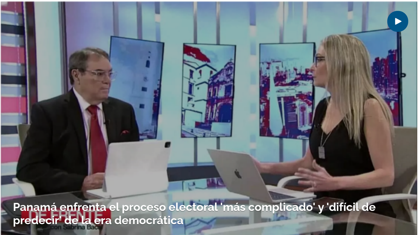
Panamá enfrenta el proceso electoral 'más complicado' y 'difícil de predecir' de la era democrática