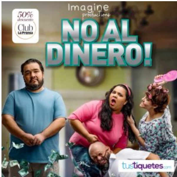
No al dinero Miércoles, 10 abril de 2024