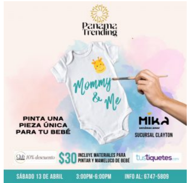
Mommy and Me Sábado, 13 de abril de 2024