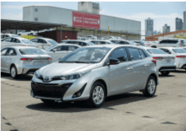
Certificado Toyota Yaris Hatchback 2020 | CZ9956 $16,500