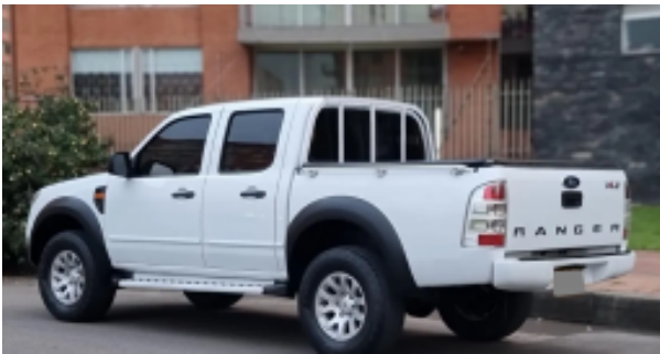
Usado FORD RANGER 2010 $5,000