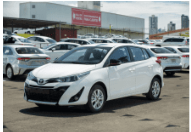
Certificado Toyota Yaris Hatchback 2020 | CZ9967 $16,500