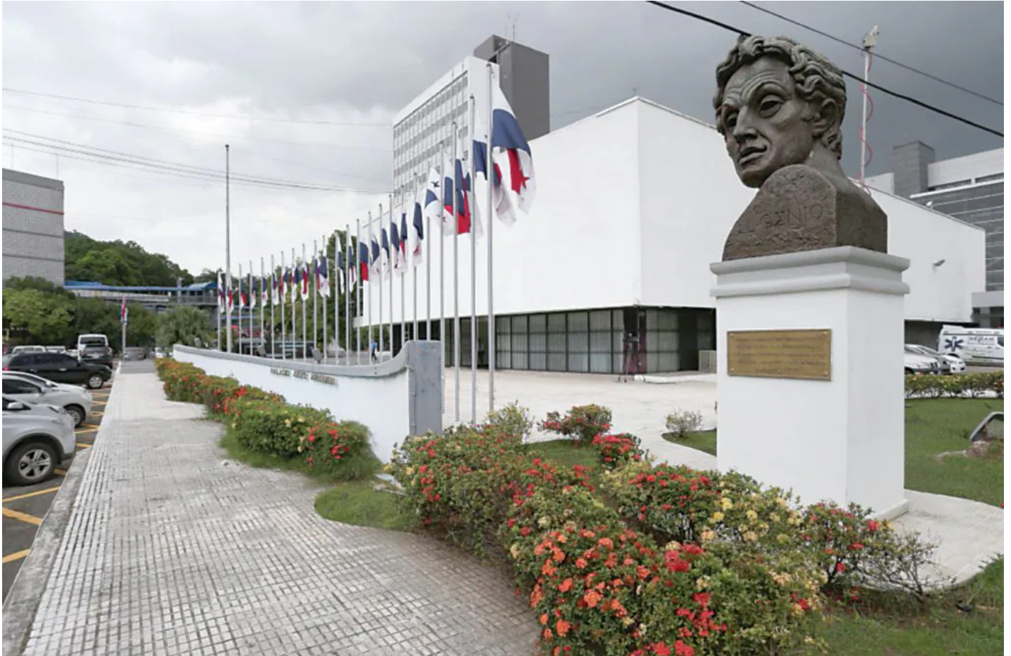
Palacio Justo Arosemena, sede de la Asamblea Nacional.