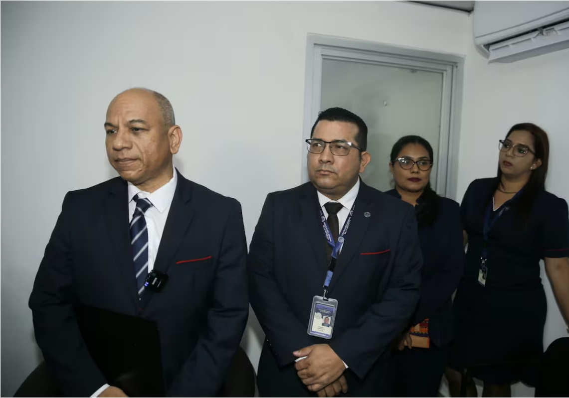
Audidores en el legislativo.

“Eso lo vamos a auditar porque allí es donde estamos viendo, y la gente clama, que están los cashback . Vamos a corroborarlo”, dijo.