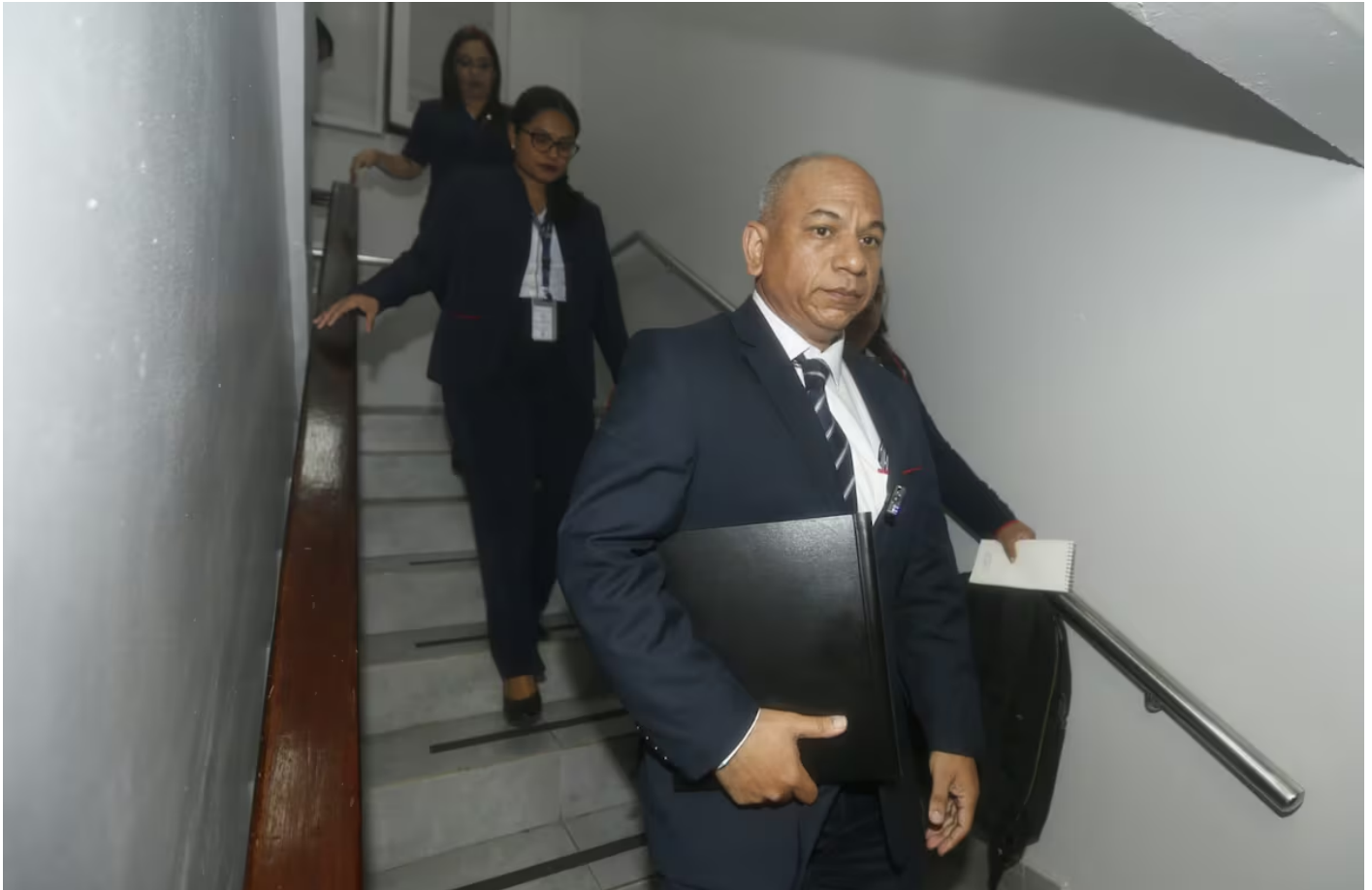
Audidores de la Contraloría entran a la Asamblea Nacional.