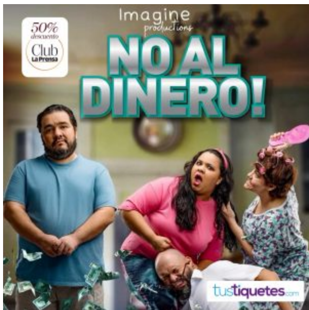
No al dinero Miércoles, 10 abril de 2024