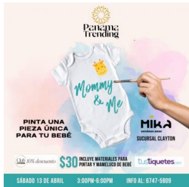
Mommy and Me Sábado, 13 de abril de 2024