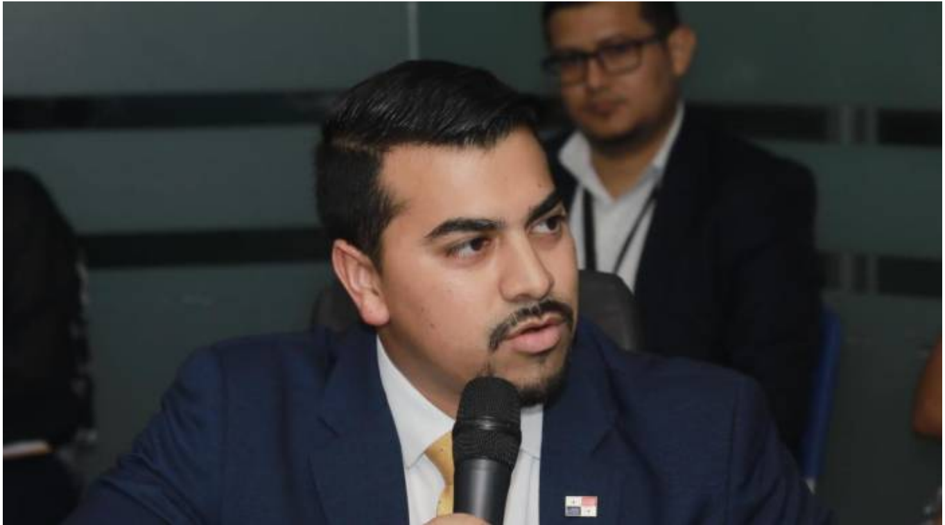
Diputado Augusto Palacios, de la bancada independiente Vamos.

AN: ASAMBLEA NACIONAL / CÓDIGO ELECTORAL