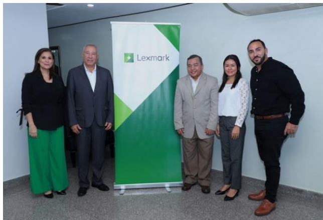
ALTOS EJECUTIVOS DE LEXMARK EN LA ASAMBLEA