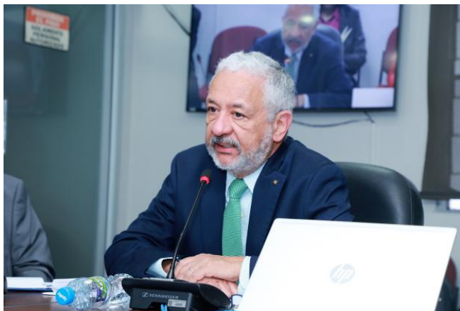
APRUEBAN EN PRIMER DEBATE PRESUPUESTO DE LA A...