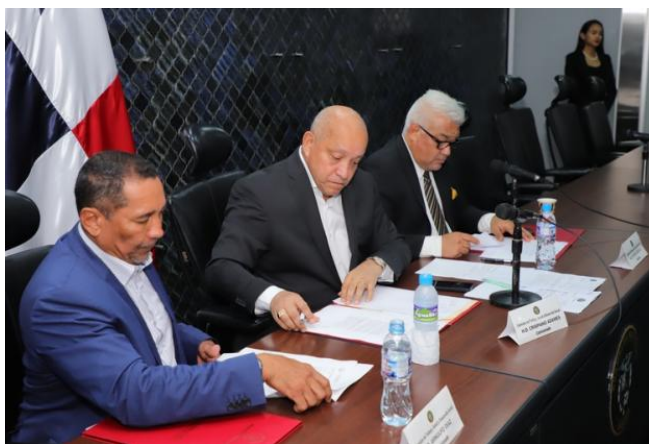
ANALIZAN CREACIÓN DE LA DIRECCIÓN NACIONAL DE...