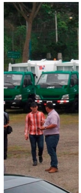
Camiones de la Autoric $180

En el análisis actualizado del Índice, publicado por la Iniciativa en septiembre pasado, se explica que los actores del sector privado de Panamá "están fuertemente involucrados en actividades criminales, especialmente en delitos financieros y lavado de dinero".