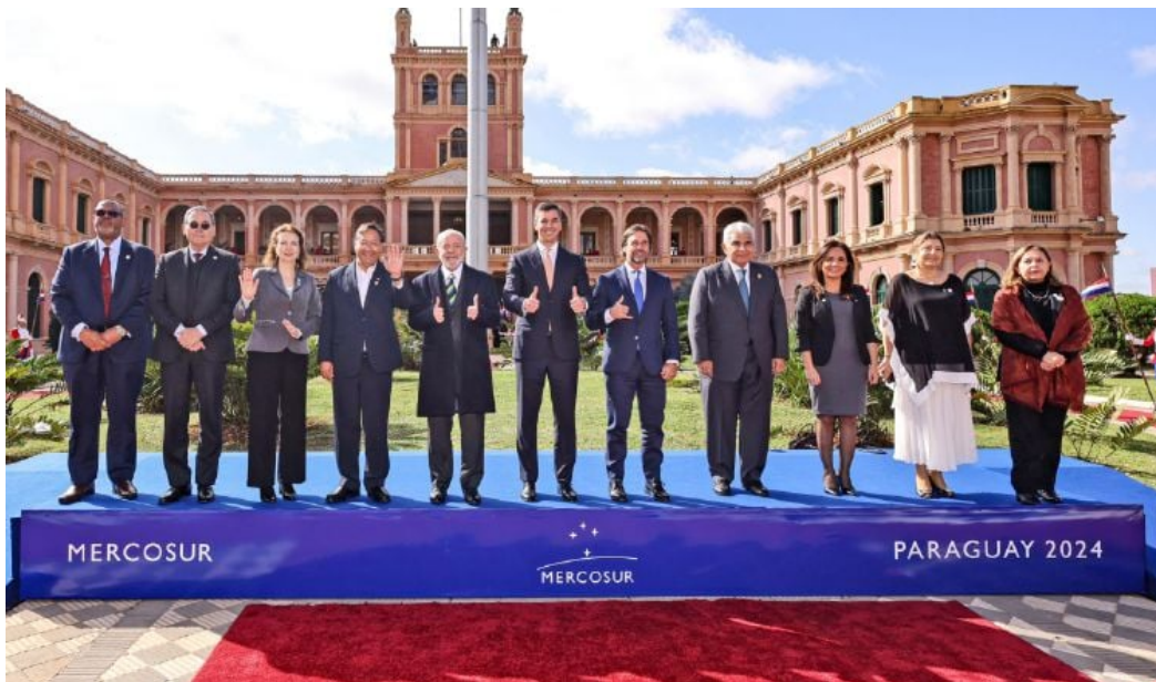
Integración al Mercosur será un proceso lento y gradual